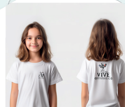
1 Tee-shirt blanc