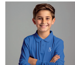
1 Polo bleu manches longues