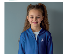
1 Veste zippée bleue