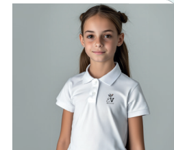
1 Polo blanc manches courtes