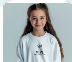
1 Sweat-shirt blanc