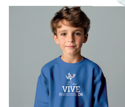
1 Sweat-shirt bleu