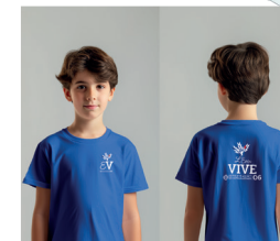
2 Tee-shirts bleus