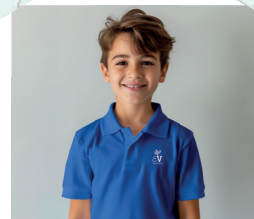
1 Polo bleu manches courtes