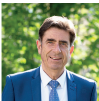
Charles Ange Ginésy, Président du Département des Alpes-Maritimes

Le kit de la tenue scolaire des Alpes-Maritimes est composé de :