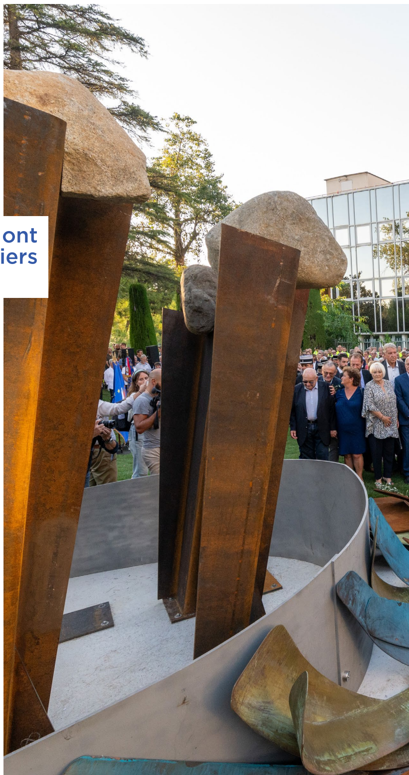
Cérémonie de commémoration des trois ans de la tempête Alex et inauguration de l'oeuvre mémorielle «Avenir» réalisée par l'artiste Ernest Altés, le 29 septembre 2023

La construction, qui a débuté, du nouveau Pont des 14 arches à Tende. Toujours à Tende, l'appel d'offres pour le pont du Bourg-Neuf va être lancé en vue d'un démarrage des travaux en 2024. Des travaux vont également être menés sur la RD6204 pour l'accès au tunnel de Tende. Enfin, vont être finalisés divers travaux complémentaires : pose d'enrobés, protection contre les chutes de pierre, aménagement de pistes de montagne. 2024 sera l'année de l'achèvement des chantiers dans la Roya. Le Département va encore y engager plus d'une quarantaine de millions d'euros.