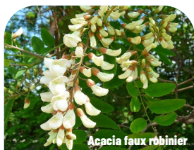
Acacia faux robinier