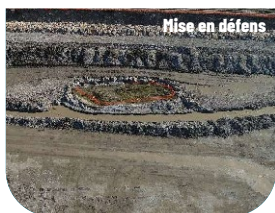
Mise en défens