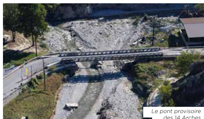
Le pont provisoire des 14 Arches