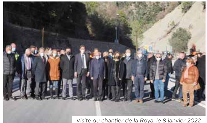
Visite du chantier de la Roya, le 8 janvier 2022