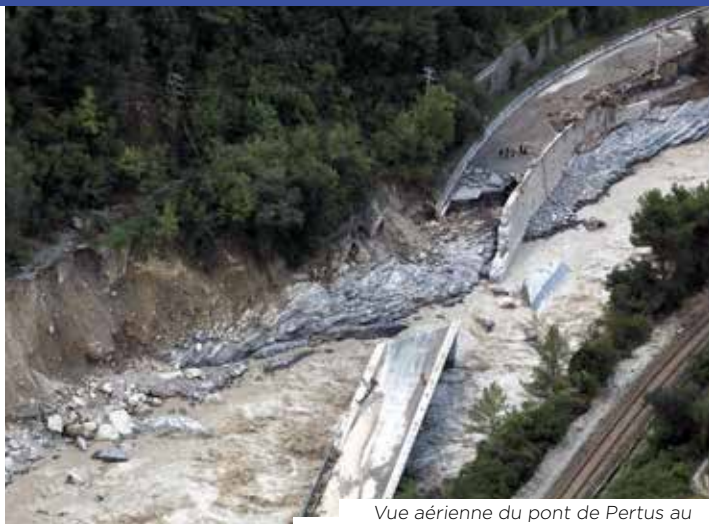
Vue aérienne du pont de Pertus au lendemain du passage de la tempête Alex.

Dès décembre 2020, le Département avait achevé les études de conception pour la reconstruction du Pont de Pertus.