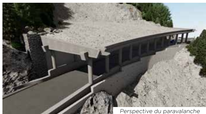
Perspective du paravalanche

L'ouvrage sera mis en service en novembre 2022 et rendra accessible en voiture la section Mesches à Castérino par la RD91 reconstruite. Jusqu'à leur achèvement, l'exiguïté des lieux ne permet malheureusement pas de réaliser les travaux avec une circulation automobile concomitante. Pour les piétons, ne pouvant également franchir la zone de travaux, le Département étudie la mise en œuvre d'une passerelle piétonne permettant d'accéder à Castérino depuis la zone des Mesches, où, les touristes et résidents de Castérino pourront laisser leur voiture.