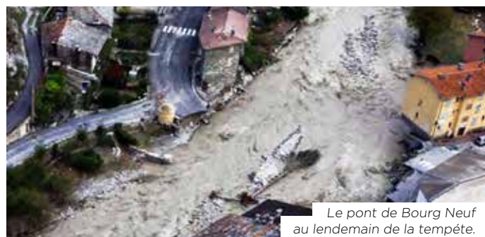
Le pont de Bourg Neuf au lendemain de la tempête.