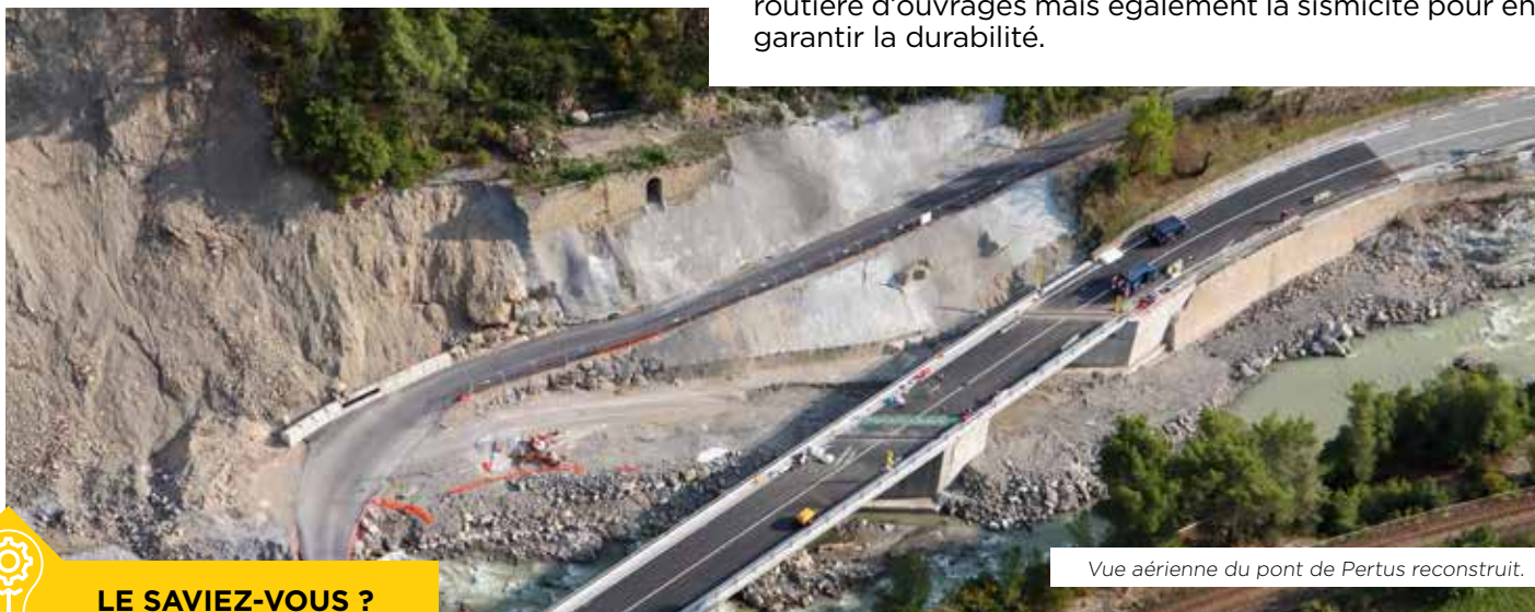
Vue aérienne du pont de Pertus reconstruit.

Un ouvrage pérenne et pensé pour la sécurité de tous.