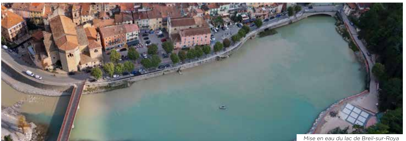
Mise en eau du lac de Breil-sur-Roya